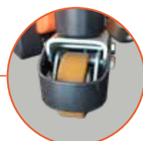
Ruote stabilizzatrici laterali "Stability Caster™"